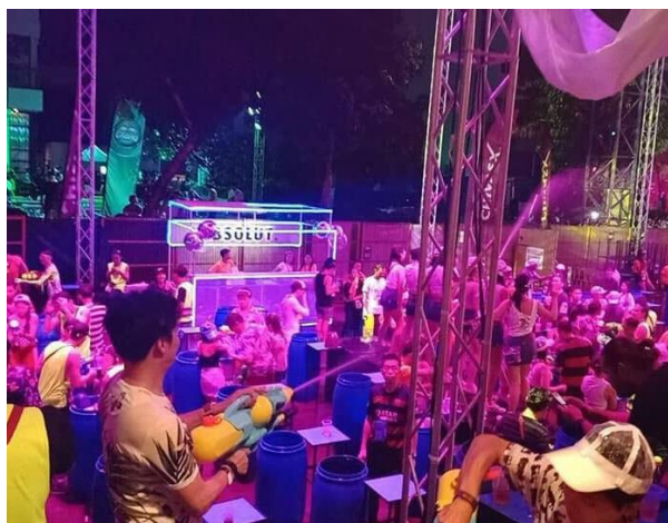
タイの水かけ祭りの様子