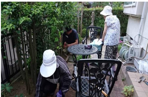
生活支援サービスの一例