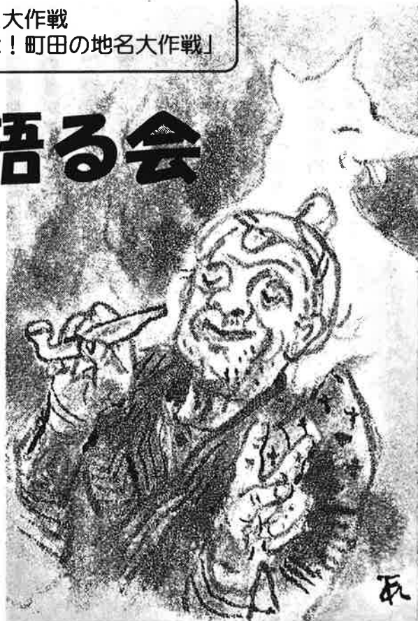
『町田の民話と伝承』より

三輪は、奈良の大神神社と関わりがあるといわれ、町名にもなっています。また、古墳なども多く残っており、町田市では特異な場所です。三輪には「こどもの国」や「三輪緑山」の住宅地ができましたが、まだ多くの自然が残っています。昔話（民話）や地名から三輪について、一緒に考えてみたいと思います。大勢の方のご参加をお待ちしています。