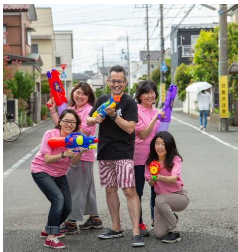
木曽南自治会の皆さん