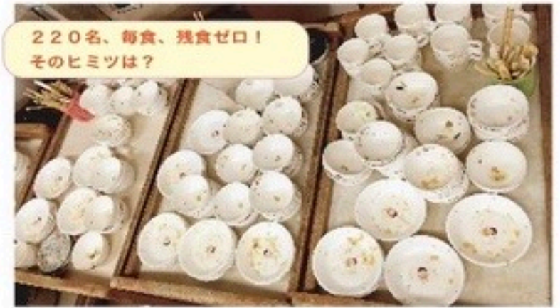
220名、毎食、残食ゼロ！ そのヒミツは？