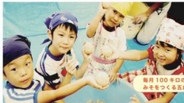
毎月100キロのみそをつくる五歳園児

公開18ヶ月、口コミだけで全国45県にまで広がった、笑って、泣いて、ほっこり癒される、子育てエンターテイメント！全国の劇場で公開された「劇場版」が自主上映開始です。 (いただきます劇場版 75分)